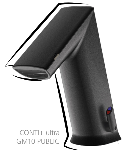
CONTI+ ultra GM10 PUBLIC