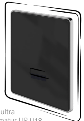
CONTI+ ultra Urinalarmatur UP U18