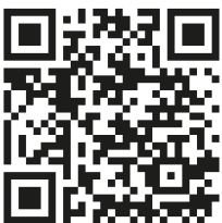
CONTI+ Thermostat-E online