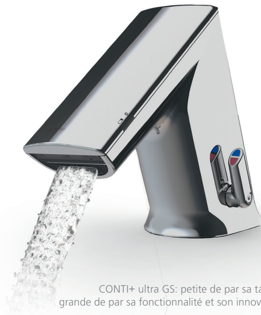
CONTI+ ultra GS: petite de par sa taille – grande de par sa fonctionnalité et son innovation

L'ensemble de l'entretien s'effectue au-dessus du lavabo seulement. Les états de fonctionnement, comme par exemple « Pile faible », sont signalés de façon bien reconnaissable par les LED latérales.