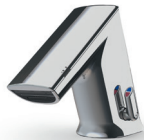
GS Hauteur totale: 124 mm Hauteur d'écoulement: 51 mm

La CONTI+ ultra est disponible en trois tailles avec ou sans mitigeur. Chaque modèle est préparé pour l'échange de données par radio et câble.