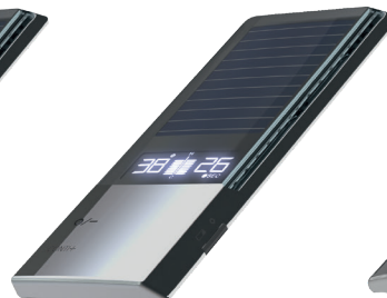
Expert Solar Cellules photovoltaïques et affichage de la température et du temps d'écoulement de l'eau.