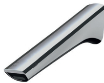
Montage mural sans photovoltaïque Longueur d'écoulement: 244 mm Hauteur d'écoulement: librement sélectionnable

Le modèle mural au design de qualité convient pour un emploi dans le domaine hygiénique ou lorsqu'une installation sur lavabo n'est pas souhaitée.