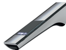
Montage mural avec photovoltaïque Longueur d'écoulement: 244 mm Hauteur d'écoulement: librement sélectionnable