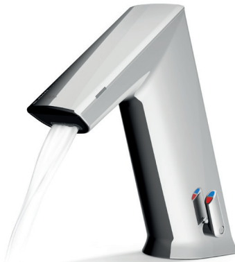
Brise-jet pour unité de vanne de 5,7 l/min