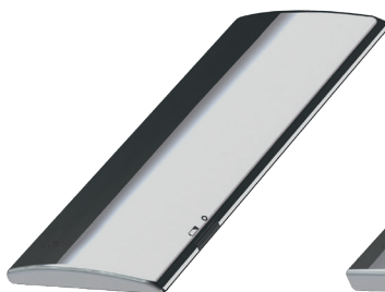
Public Le standard pour le domaine public. Un module électronique au design clair et arrondi.

Une technologie orientée design intégrée dans différents modules et options d'alimentation à un niveau d'excellence. Avec quatre options d'alimentation adaptées pour tout local sanitaire : fonctionnement sur réseau, pile, photovoltaïque ou turbine.