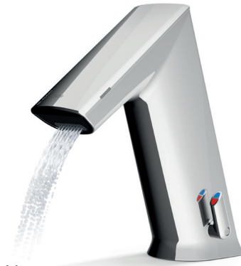
Mousseur pour unité de vanne de 1,9 l/min

Régulateur de jet individuel: débit entre 5,7 l/min et une valeur économe de 1,9 l/min avec trois modes de jet différents – pour toutes les applications.