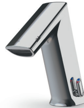
GM Hauteur totale: 178 mm Hauteur d'écoulement: 94 mm