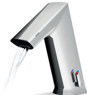
Brise-jet laminaire pour unité de vanne de 5,7 l/min