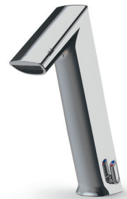
GH Hauteur totale: 252 mm Hauteur d'écoulement: 162 mm