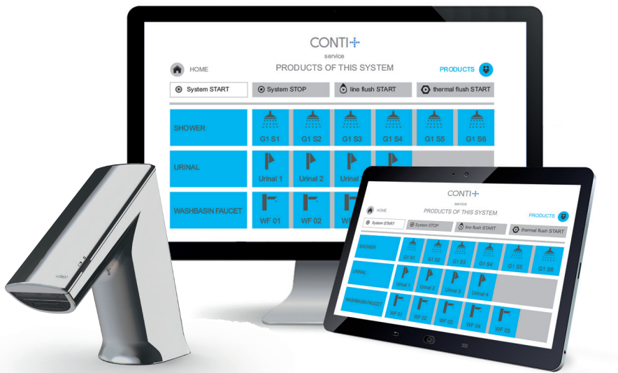
CONTI+ ultra et le système de gestion de l'eau CNX – CONTI+ – des solutions rationnelles

Le système de gestion de l'eau CNX intuitif de CONTI+ satisfait aux exigences d'hygiène à un niveau maximum. Des fonctions de programmation d'intervalles et de calendrier confortables permettent de documenter de façon automatisée, en toute simplicité, et en bonne et due forme les rinçages nécessaires.