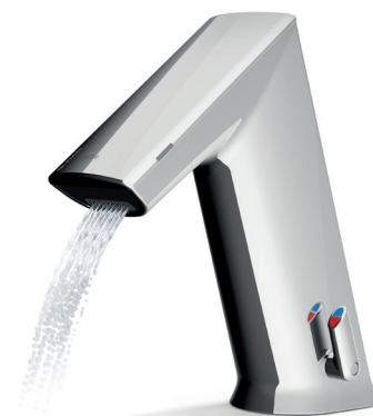
Sprühregler für 1,9 l/min Ventileinheit

Individuelle Strahlregler: In Verbindung mit der entsprechenden Ventileinheit mit 5,7 l/min oder 1,9 l/min sind verschiedene Strahlbilder erhältlich.