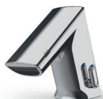
GS Gesamthöhe: 124 mm Auslaufhöhe: 51 mm

Die CONTI+ ultra ist in drei Grössen mit oder ohne Mischung erhältlich. Jedes Modell ist vorbereitet für den Datenaustausch über Funk sowie Kabel.