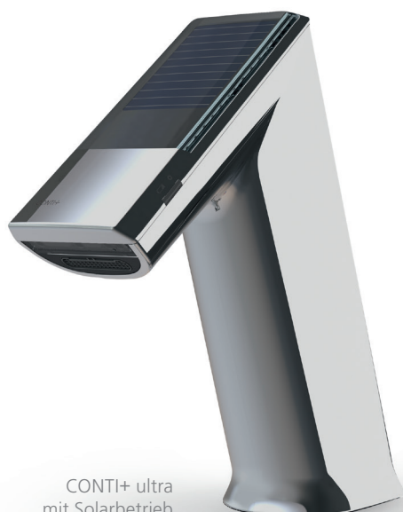
CONTI+ ultra mit Solarbetrieb

Verlängerung der Batterielebensdauer bis zu 8 Jahren durch die optionale Turbine: Ein Mini-Kraftwerk erzeugt aus dem fließenden Wasser Strom: Die ideale Lösung für hoch-frequentierte Anwendungsbereiche.