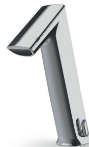
GH Gesamthöhe: 252 mm Auslaufhöhe: 162 mm