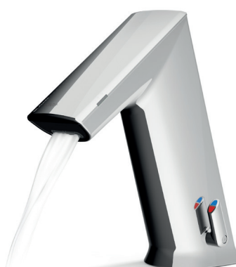
Strahlregler für 5,7 l/min Ventileinheit