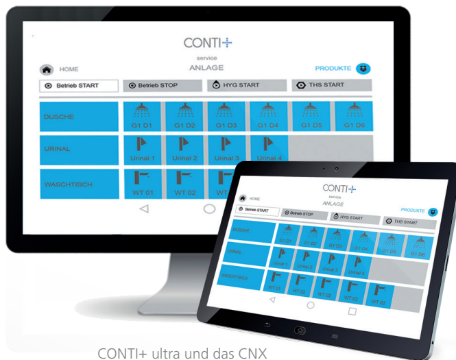
CONTI+ ultra und das CNX Wassermanagement-System – CONTI+ mit System

Das bewährte und vor allem intuitive CONTI+ CNX Wassermanagement-System erfüllt Hygieneanforderungen auf höchstem Niveau. Das intelligente System verbindet bis zu 150 Armaturen für eine zentrale Steuerung per PC, Tablet oder Smartphone.