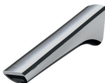
Wand ohne Solar Auslauflänge: 244 mm Auslaufhöhe: frei wählbar

Das Wandmodell im hochwertigen Design eignet sich für den Einsatz im hygienischen Bereich oder wenn die Installation auf dem Waschtisch nicht erwünscht ist.