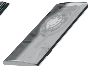
Turbine Die aus der Turbine gewonnene Energie verlängert die Batterielevensdauer bis zu 8 Jahren.