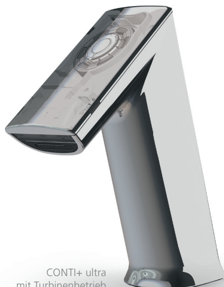
CONTI+ ultra mit Turbinenbetrieb