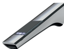
Wand mit Solar Auslauflänge: 244 mm Auslaufhöhe: frei wählbar