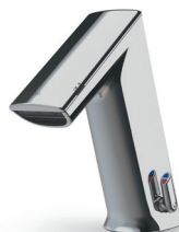
GM Gesamthöhe: 178 mm Auslaufhöhe: 94 mm