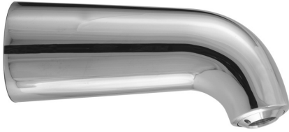
CONHEAD Brausekopf GOLF, DN15