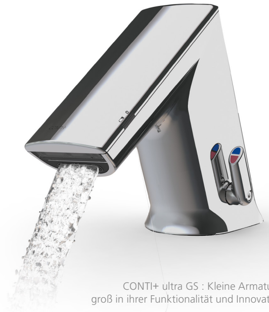
CONTI+ ultra GS : Kleine Armatur – groß in ihrer Funktionalität und Innovation

Der komplette Service erfolgt nur oberhalb des Waschtisches. Betriebszustände, wie z. B. „Batterie schwach“, werden gut erkennbar über die seitlichen LEDs signalisiert.