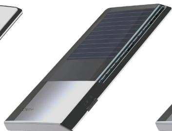
Public Solar Energie aus den Solarzellen verlängert die Batterielevensdauer bis zu 8 Jahren.