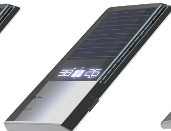
Expert Solar Solarzellen sowie Anzeige von Wassertemperatur und -laufzeit.