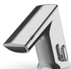
GS Gesamthöhe: 124 mm Auslaufhöhe: 51 mm

Die CONTI+ ultra ist in drei Größen mit oder ohne Mischung erhältlich. Jedes Modell ist vorbereitet für den Datenaustausch über Funk sowie Kabel.