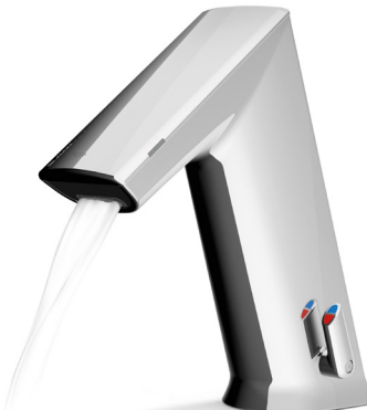
Strahlregler für 5,7 l/min Ventileinheit