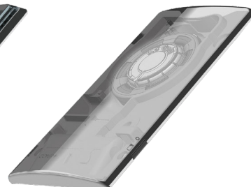
Turbine Die aus der Turbine gewonnene Energie verlängert die Batterielevensdauer bis zu 8 Jahren.